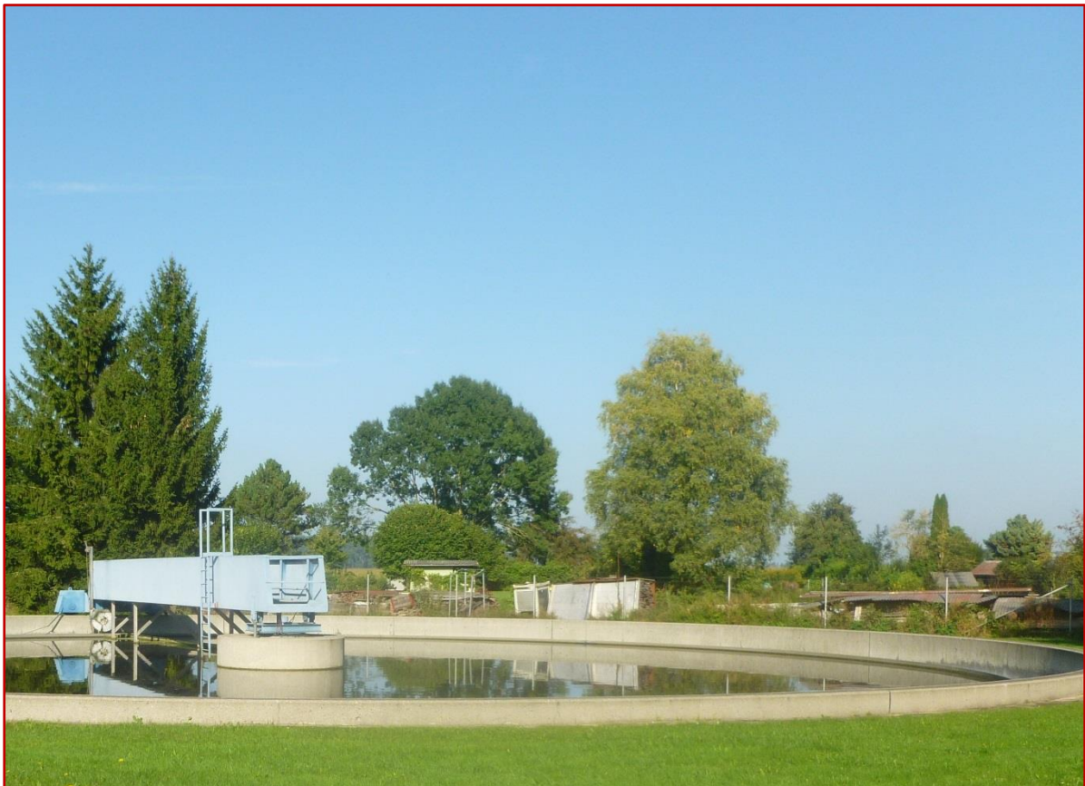
Nachklärbecken der Kläranlage