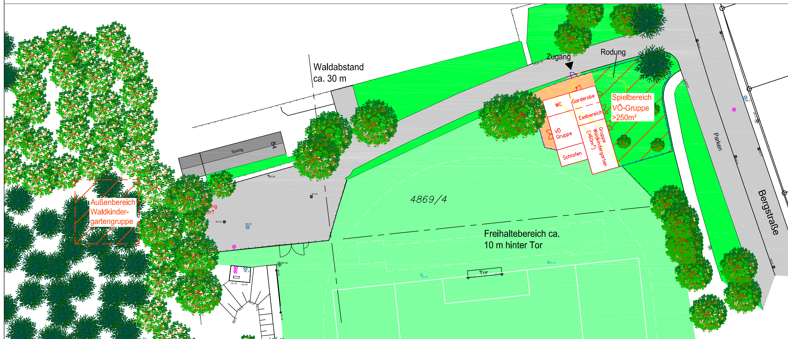
Modulbauweise Standort an Bergstraße M 1:500