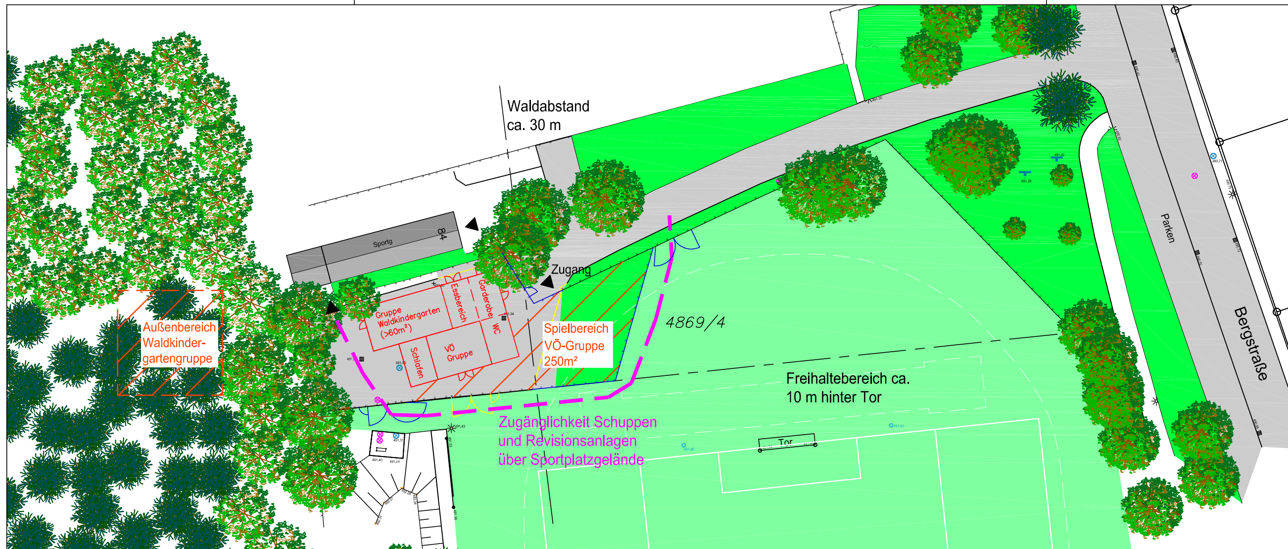
Modulbauweise Standort Basketballplatz (Wendeplatte) M 1:500